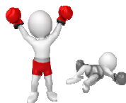
succes van anderen

... het succes van anderen als bedreigend te ervaren